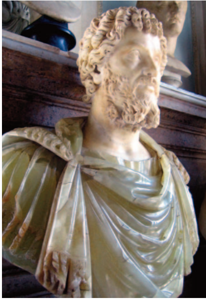
Fig. 2. Fig. 2. Septimius Severus buste, hvid marmor og alabastro verdognolo, højde 86 cm. Kapitolinske museum, Rom (MC 461).

dred fandtes flere skulptører, som restaurerede antikke værker i Rom. 10 En, som både restaurerede gamle værker og supplerede med nye, var skulptøren og samleren Bartolomeo Cavaceppi (1717–1799), som blandt andet arbejdede for kardinal Alessandro Albani fra hvis samling alabaster-Septimius og porfyr-Caracalla stammer. Seymour Howard, som skrev sin PhD-afhandling om Cavaceppi, har beskrevet ham som en, der sætter sammen dele, som ikke hører sammen, og skaber pasticher så vel som direkte forfalskninger. 11