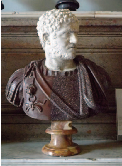
Fig. 1. Fig. 1. Caracalla buste, hvid marmor og porfyr. Kapitolske museum, Rom (MC 464).

blev marmorkopier af Caracalla-portrættet udformet af såvel kendte som ukendte kunstnere. 6 Caracalla-typen blev altså gennem århundrederne mangfoldiggjort i stort omfang, hvor de nye værker substituerede de, der tilfældigvis var overleveret fra kejserens regeringstid. Efterhånden blev det nok stadig vanskeligere at skelne gammelt fra nyt.