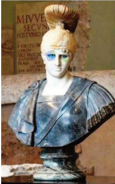
Fig. 9. Francesco Vezzoli, Achille! , 2021. Modificeret hovede på buste fra 17. århundred (foto copyright: Vezzoli).