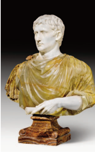
Fig. 3. Augustus buste, hvid marmor, alabastro verdognolo, siciliansk broccatello, ca 1650.