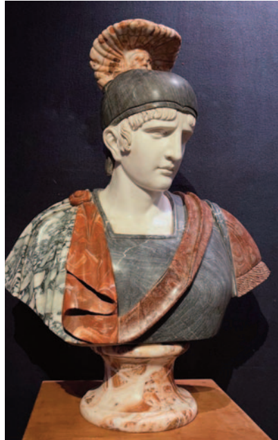
Fig. 10. Ukendt kunstner, Krigerbuste i diverse stensorter , ca 1950–2000. Fra kunstmarkedet (foto: proantic. Com, ref. 1280474).

til direkte på antikke hoveder, som han har erhvervet på auktion. Værket Achille! fra 2021 består af en genbrugt panserbuste i mørkgrå sten fra omkring det 17. århundrede og et hjelmklædt hovede i hvid marmor, på hvilket Vezzoli har malet med blå farve omkring det ene øje (Fig. 9). 19 Det er interessant, at en lignende skulptur af en ung hjelmklædt mand – «Important colored marble bust in the taste of antique, Italy» – dateret til anden halvdel af det 20. århundrede, nylig er budt til salg for 5500 euro via netstedet Proantic.com i Frankrig. Det er ikke så megen information der gives om sidstnævnte, udover at den skulle være italiensk og vejer mellem 120 og 140 kg, hvor såvel proveniens som tyngde måske skal borge for kvaliteten (Fig. 10). 20