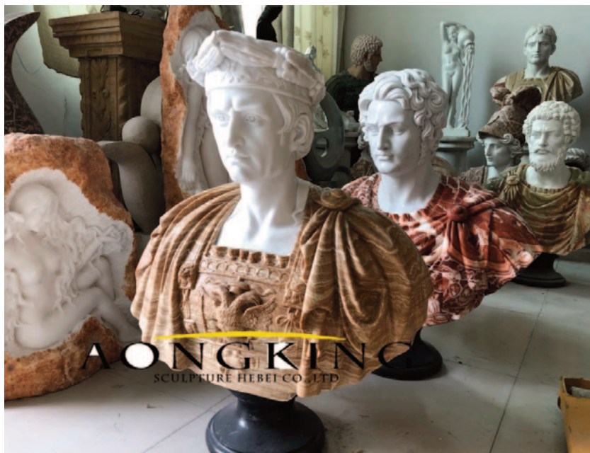
Fig. 6. Eksempler på skulptur fra AongKing i Kina

Selv om værkerne lanceres som à l'antique eller after the antique , eller under betegnelser som «antique Greek Roman bust statue», er de ofte nok