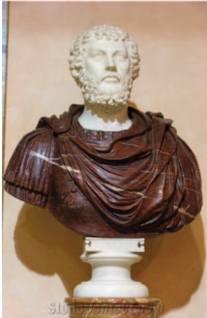
Fig. 8. Moderne kejserbuste fra Kina. Septimius Severus (?). Hvid og emperador mørkbrun kinesisk marmor.

selvfølgelig også bestille kvindebuster, en Athena eller en mere romantisk kvindefigur.