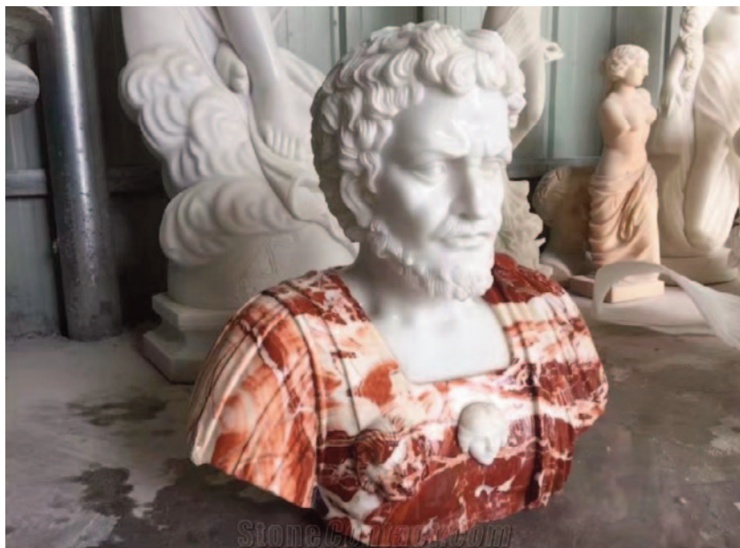
Fig. 7. Moderne kejserbuste fra Kina. Marcus Aurelius?, hvid og rød kinesisk marmor.

Mest populær blandt kinesiske ny-antikker synes at være et hvidt hovede kombineret med en rødspraglet buste (Fig. 7). Busten kan være udformet enten som et panser, med eller uden kappe, eller den kan være draperet, henholdsvis en militær og en civil dragt. Portræthovederne varierer på den måde, at nogle er baseret på kendte antikke portrættyper og man genkender for eksempel Augustus, Marcus Aurelius eller Caracalla. Men en stor del virker ganske typificerede og anonyme, eller blander træk fra flere kejsere, så det er vanskelig at identificere en specifik model (Fig. 8). Endelig er der også den mulighed, at selvom figuren er klædt som imperator , behøver hovedet ikke at illudere en kejser, men kan også godtages som en (krigerisk) filosof. Som det fremgår blandt andet av East sculpture products, kan man