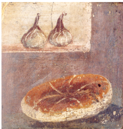
Fig. 10. Xenia fra Herculaneum, huset er ikke oppgitt. Øverst fiken, nederst et brød. Napoli, Museo Archeologico Nazionale. Fra: Brigantini og Sanpaolo, op. cit.