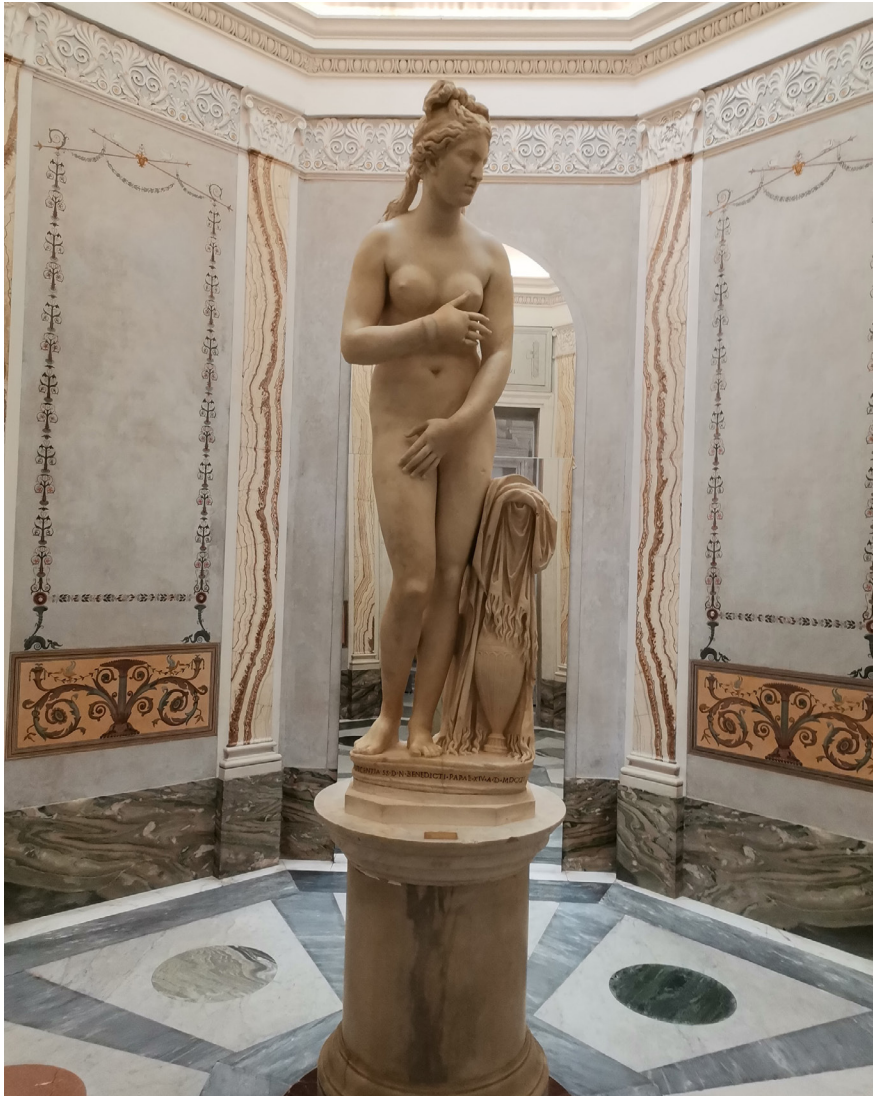
Fig. 6. «Den Kapitolinske Venus», statue i Roma, Musei Capitolini.

Trimalchius' gjestebud serveres en rett som til forveksling ligner en helstekt gås, men som er laget av svinekjøtt ( Satyricon , 69–70). Beskrivelsen av Trimalchius' bankett er god å ha i bakhodet når vi leser om Elagabals gjestebud,