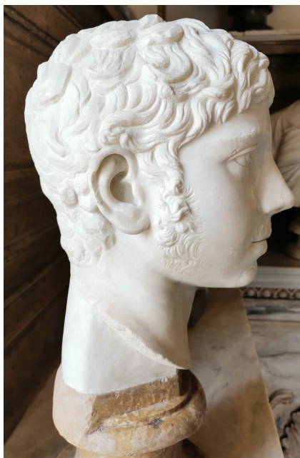
Fig. 2 a-b. Portretthode av keiser Elagabal, type 2. Roma. Musei Capitolini.

om målene ikke helt stemmer. Roma-hodets høyde fra hake til isse er 24,5 cm, altså 2 cm mer enn Oslo-hodets. Dette skyldes at den som hugget sistnevnte hode, brukte et eldre hode som råstoff, og derfor måtte han forminske sin versjon en smule.