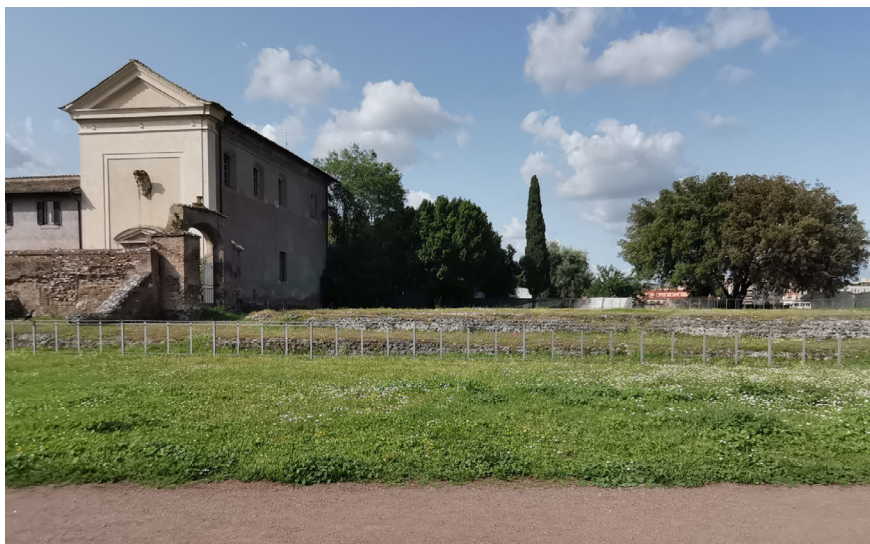
Fig. 4. Roma, Palatinen, Vigna Barberini. Terrassen for Elagabals Sol-tempel.

på hesteryggen må ha gitt soldatene assosiasjoner til Aleksander den Store.