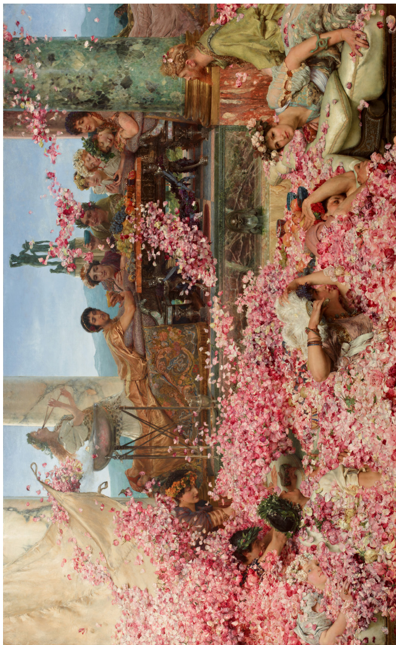
Fig. 8. «The Roses of Heliogabalus», maleri av Lawrence Alma-Tadema, 1888. Privat samling.