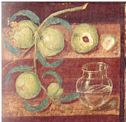
Fig. 9. Xenia fra Herculaneum, Casa dei Cervi. Gjennomsiktig glass fylt med vann samt frukter. Disse er omtalt som fersken i katalogen. I så fall må de være umodne. Napoli, Museo Archeologico Nazionale. Fra: Brigantini og Sanpaolo, op. cit.

Hvor uvanlige var Elagabals eksentriske handlinger? Når det gjelder fremstillinger av mat, er det selvfølgelig ikke bevart versjoner i forgjengelige materialer som broderi og voks, men vi har malerier og mosaikker som viser mat eller potensiell mat som fugler eller dyr. Slike bilder ble kalt xenia (Vitruvius, de architectura VI,vii,4), og de henspilte på gaver til gjestene (gr. xenos betyr gjest) eller mat som de kunne regne med å få servert. Over tre hundre xenia er bevart fra Vesuvbyene (Figs. 9–10). En hel bok med epigrammer av Martial (nr. 13) kalles xenia , og den beskriver forskjellige gjestegaver (ikke bare mat). Fremstillinger av mat var altså relativt vanlige i de bedre romerske hjem, men det som var spesielt med Elagabal, var at gjestene ikke fikk noe å spise, men måtte nøye seg med bildene.