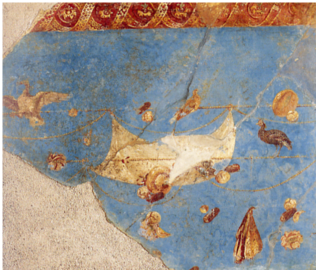
Fig. 7. Gjestegaver som faller fra et utspent seil, veggmaleri fra Casa di M. Fabius Rufus, VII Insula Occidentalis, Pompeii. Napoli, Museo Archeologico Nazionale. OK

Folk som ikke hadde råd til slike takkonstruksjoner, kunne spenne ut et seil, nesten som en hengekøye, over gjestene. I seilet lå det blomster eller små gaver. Disse falt ned over gjestene når man vred rundt repene som holdt seilet utspent. To veggmalerier fra Pompeii, et fra Casa di M. Fabius Rufus og et fra Casa della caccia antica, viser øyeblikket hvor seilet vris rundt og innholdet begynner å falle ut (Fig. 7). Som vi forstår, var det ikke uvanlig å overstrø gjestene med blomster eller gaver, men i Elagabals tilfelle beskrives denne skikken på en så overdreven måte at noen av gjestene mister livet. Den nederlandsk-britiske maleren Lawrence Alma-Tadema (1836–1912) har laget et berømt maleri av Elagabals gjestebud, hvor gjestene nærmest drukner i rosenblader (Fig. 8).