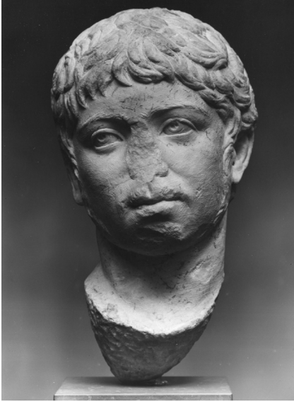
Fig. 1 a-c. Portretthode av keiser Elagabal, type 2. Oslo, Nasjonalmuseet for kunst, arkitektur og design.