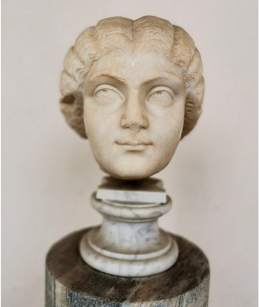
Fig. 5. Kvinneportrett som antagelig viser en av Elagabals hustruer, muligens Aquilia Severa. Også dette portrettet er gjenbrukt. Roma, Museo Nazionale Romano.

På kort tid hadde keiseren klart å få det romerske folk og senat mot seg, enda han først ble velvillig mottatt. Som hans biograf Aelius Lampridius skrev: «Han hadde det gode rykte som en ny hersker ofte får når han etterfølger