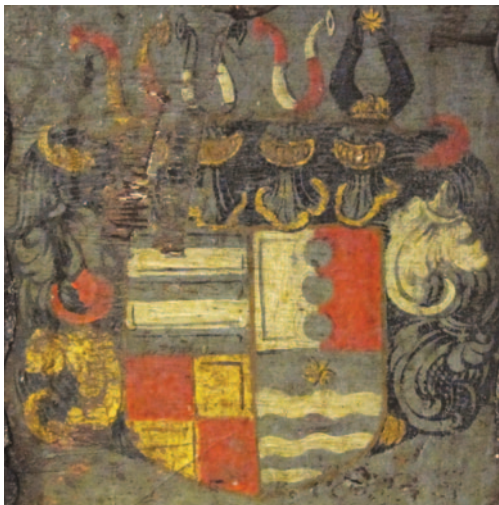
Utsnitt av kisten over. Foto (beskåret): Carl Huitfeldt.

Så langt har jeg behandlet Dorthes autoritet i saker som dreier rundt gods, makt, lokale forhold og familierelasjoner. Én autoritetsrolle gjenstår å nevne, nemlig hennes rolle knyttet til Onsøy kirke. Her hadde Dorthe en funksjon som hun ser ut til å ha holdt uavhengig av både ektemann og svigersønn,