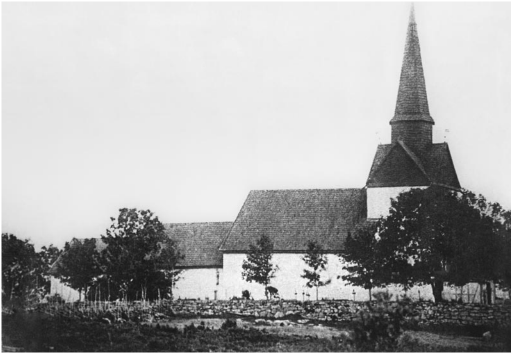
Den gamle kirken i Onsøy (Kolberg), fotografert før 1875. Middelalderkirken ble revet i 1875 og erstattet med en ny kirke.

kan for eksempel ha vært tilfelle dersom den nye lensinnehaveren oppholdt seg mer i Danmark.