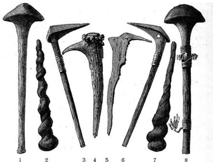
Fig. 102. — 1 et 8. Casse-tête modernes des sauvages de la Nouvelle-Calédonie, Exposition universelle de 1878. — 2 et 7. Massues des sauvages de l'Afrique centrale. — 3 et 6. Casse-tête modernes de la Nouvelle-Calédonie, Exposition universelle de 1878. — 4. Outil en corne de cerf de la collection Boucher de Perthes. — 5. Andouiller de cerf servant d'arme, Exposition universelle de 1878. Provenance lacustre.

I en rekke museumssamlinger finnes objekter av typen «kannibalgafler», «skalleknusere», o.l. — et resultat av en nærmest sykelig vestlig interesse for slike gjenstander. Typen «kannibalgaffel fra Fiji, et instrument for å trekke ut fiendens tærmer» ble et av de mest populære objektene i vestlige museer på siste del av 1800-tallet. Både gaflene og skalleknuserklubbene var gjerne objekter med feiltolket funksjon eller rene forfalskninger. Serien med klubber ble vist på verdensutstillingen i 1878. Begge plansjene fra utstillingen Kannibaler & sydhavspiker . Bilder fra Sydhavet, MAAO 2001-02.