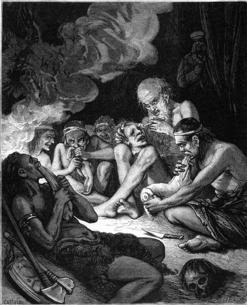
LES ANTHROPOPHAGES DE LA NOUVELLE-CALÉDONIE. — Le vieux chef crevant les yeux du crâne. (Page 244.)

ILLUSTRATIONS. — Les Anthropophages de la Nouvelle-Calédonie : le vieux chef crevant les yeux du crâne. — Saint-Pétersbourg : la cathédrale de Saint-Isaac, la statue équestre de Pierre le Grand, la colonne navale, les palais du tsar et du tzarévitch. — L'Aérophore Denayrouse. — Carte du département de l'Eure.