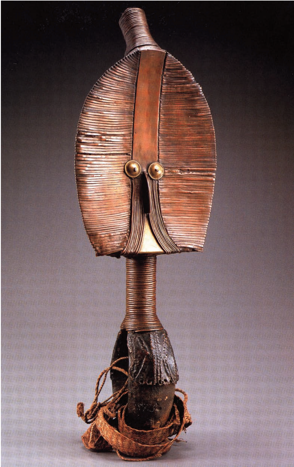
Skulptur fra Gabon, første del av 1800-tallet, utstilt i le Pavillion des Sessions, Louvre. Denne ofte viste skulpturen i tre og messing (H ca. 60 cm) er blitt en slags eksponent for tradisjonell afrikansk kunst. Musée de quai Branly/Hughes Dubois.