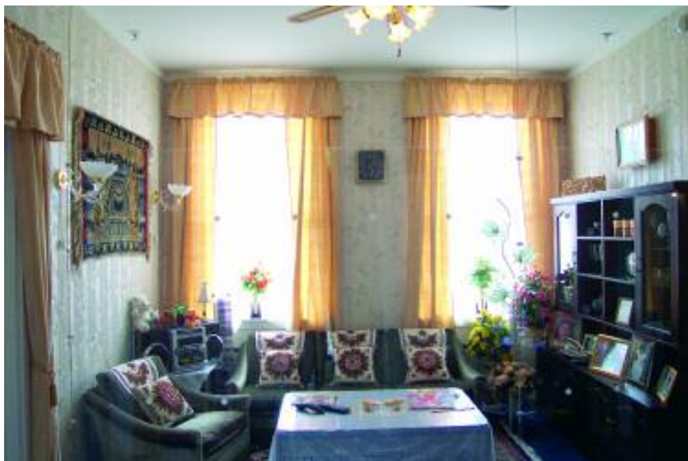
Stua i utstillingshjemmet, fotografert kort før åpningen. En plexiglassvegg tvers gjennom rommet skiller publikum fra møbler og gjenstander. Bildet er tatt fra døren ut til trappegangen. Til venstre er døren til foreldrenes soverom, til høyre utenfor billedkanten er barnas soverom, som også er gjennomgang til kjøkken, bad og gang. Sofagruppen i mosegrønn velur ble kort tid etter vannskadet på grunn av en feil i sprinkleranlegget, og ble skiftet ut med en i gammelrosa velur.

som mulig. Der hvor det bevisst ble gjort endringer, var det enten ut fra at romstørrelser og planløsning gjorde slike endringer nødvendige, eller ut fra observasjoner vi gjorde i andre pakistanske hjem som vi etter hvert besøkte. Noen detaljer ble også endret fordi vi av etiske grunner ikke ville gå informantene altfor nært innpå livet. I ettertid ville det kunne oppleves som overtramp i forhold til deres integritet. Men i det store og hele ble hjemmet til familien H modell for det pakistanske hjemmet på Norsk Folkemuseum. At kopieringen var vellykket, fikk vi bekreftet av mor og datter da de kom på inspeksjon i den nesten ferdige utstillingen. De rettet bare på noen småting, og konkluderte så med at dette var