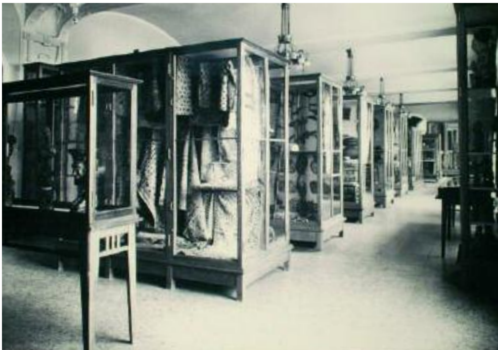
Fra Afrika-salen i de nyåpnede etnografiske utstillinger i Historisk Museum på Tullinløkka..

Afrika: "De Besøgende gaar fra Hovedindgangen til Frederiksgade op i tredje Etage, hvor de vender sig tilhøire og begynder Vandringen gjennom Musæet i den Rækkefølge, hvori Salene med deres Indhold herefter beskrives" (Nielsen 1904:5). Nielsen hadde besluttet at publikum skulle begynne i Afrika. Norsk misjon var engasjert i det sydlige Afrika og derfor var det zuluene som dominerte i de tre første skapene. Mer oppsiktsvekkende er det at Kongofolkene fylte over halvparten av de 38 skapene i Afrikasalen, ja det var faktisk den største regionale utstilling overhode i de nye etnografiske salene: