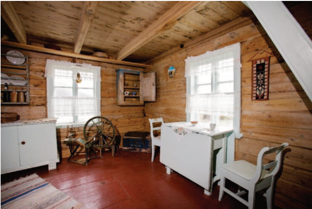
FIGUR 1: Kjøkkenet på Gamslett fiskerbondegård på Svensby i Lyngen.

undersøker hvordan økt globalisering påvirker vår forståelse av kultur og identitet og hvordan lokalhistorie kan formidles i skjæringspunktet mellom lokal tilhørighet og global flyt. Finnes det vesentlige forskjeller mellom det lokale økomuseet og det globale mangfoldsmuseet, eller går vi over bekken etter vann når vi tar inn nye begreper om museets formål? Artikkelen er utviklet gjennom forskningsmidler fra Kulturrådets utviklingsprogram til nettverket Dutkan Davin – Forskning i Nord, og gir et bidrag til en pågående diskusjon om museenes samfunnsrolle.