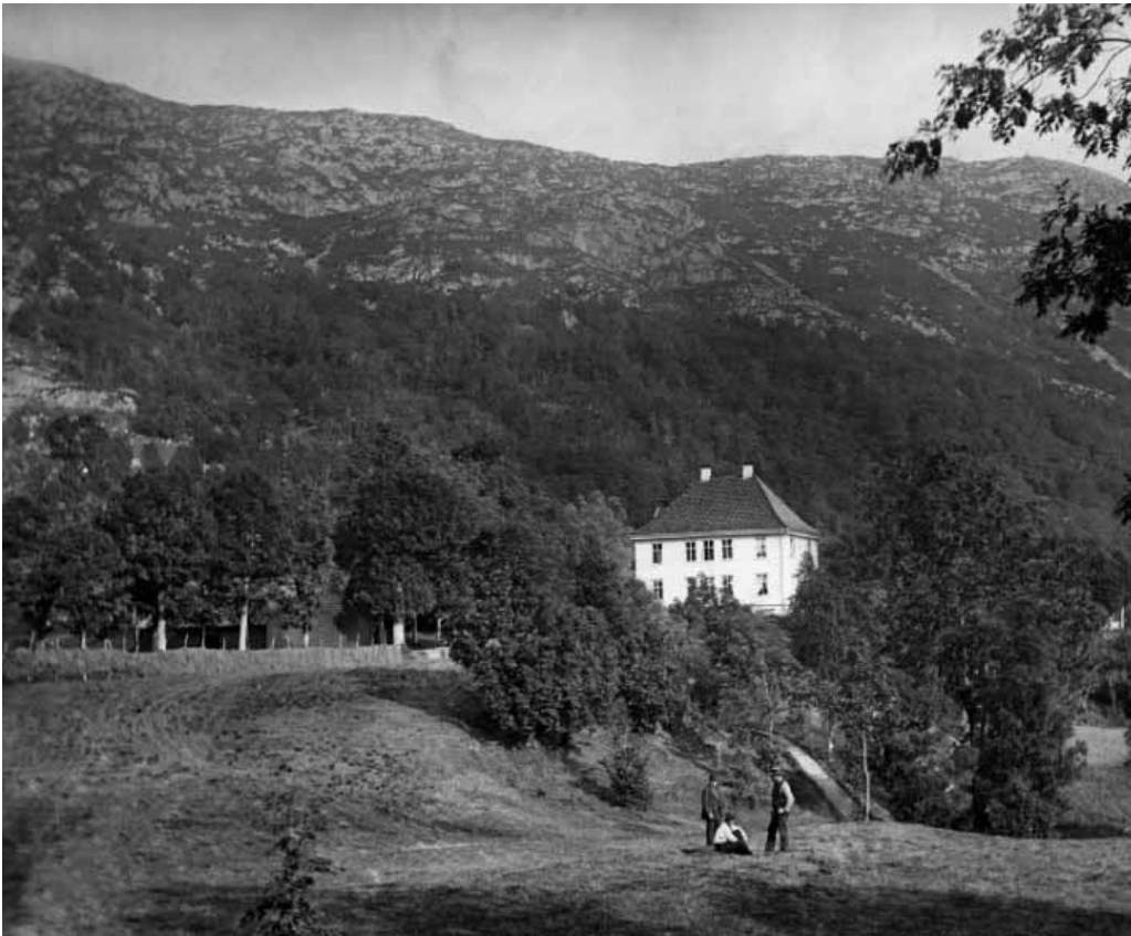
Figur 3: Landås hovedgård i 1870'erne. Foto: Knud Knudsen, ubb- kk-nbx-0503, Marcus UiB