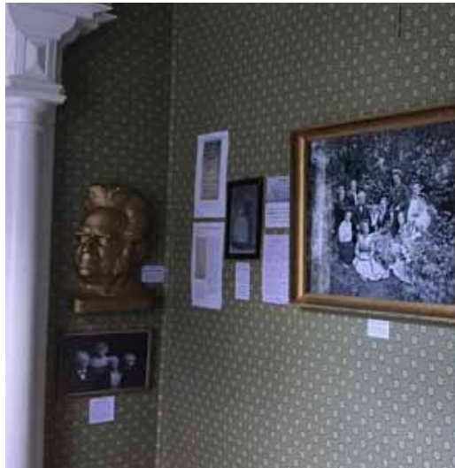
Figur 6: Udsnit af Griegudstillingen på Lystgården.