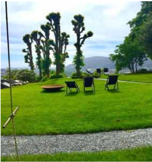
Figur 5: Haven på Lystgården, Landås. Foto Lone Milkær, 2018