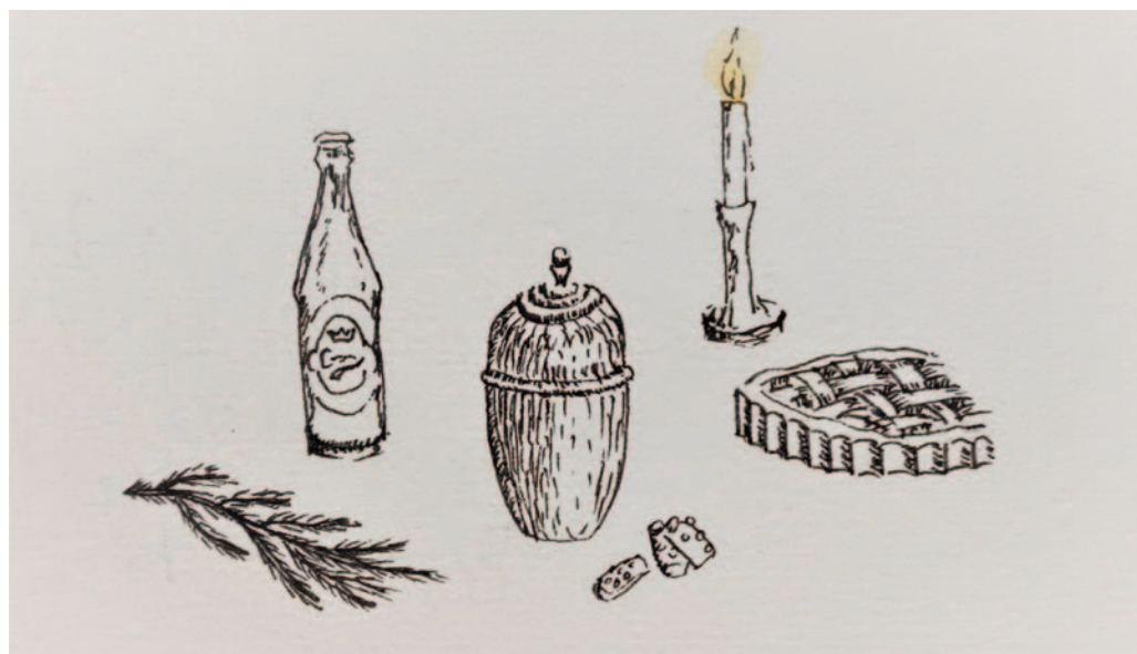
Figur 1: Under minnesstunderna kombineras välbekanta begravningsinslag som tal, ljus och musik med personligt präglade detaljer som danskt öl, äppelkaka, grankvistar och finska pinnar.