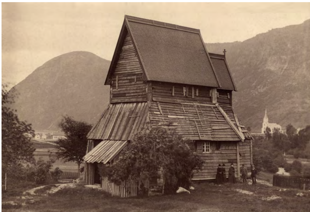
Hopperstad stavkirke i dårlig stand. Her med plankebekledning for å beskytte den bevarte middelalderkirken etter at alle nyere tilbygg er tatt bort, ca. 1880.

Men går vi lenger tilbake, til for eksempel første halvdel av 1800-tallet, var altså stavkirkenes status en helt annen. Mange av dem var i dårlig stand, og de ble oppfattet som mørke, kalde, upraktiske, og ikke minst i mange tilfeller for små for et stadig voksende innbyggertall. Det var dermed slett ikke gitt at staten skulle bevilge noe som helst til bevaring av slike bygninger, selv om bevilgninger i visse tilfeller ble gitt. Sitatet over, «Blot det ei var for silde!», er hentet fra overskriften til en to sider lang avisartikkel i Morgenbladet 3. juni 1844, hvor forfatteren beklager seg over tidens «uforstand»: «Det skulde lede til altfor stor Vidløftighed her at opregne alle de gamle norske Stavekirker, der, Tid efter anden, paa den uforsvarligste