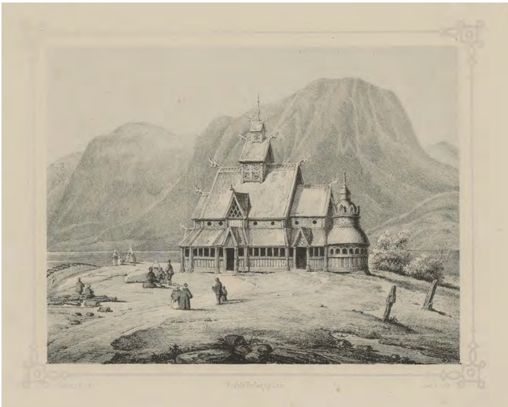
Vang stavkirke, trykket i Schiertz (1848).

nyttig å gjøre et skille mellom på den ene siden representerte tider i teksten, og på den andre siden tekstens «egne tider» – et skille som på mange måter har å gjøre med et analytisk skille mellom teksten som «handling», og teksten som «kulturelt produkt»: Å studere tider i tekst, må nemlig nødvendigvis også innebære å studere tekster i tiden – tekster som kommunikative handlinger, hvor ulike tider eller rytmer representeres og kommuniseres i konkrete situasjoner. Men samtidig er tekster også et resultat av kulturell praksis , det vil si handlinger som altså baserer seg på eksisterende, delvis delte kulturelle ressurser, som sjangrer, i tillegg til at de også er del av en større kulturell kontekst enn bare en konkret kommunikasjonsituasjon. 14