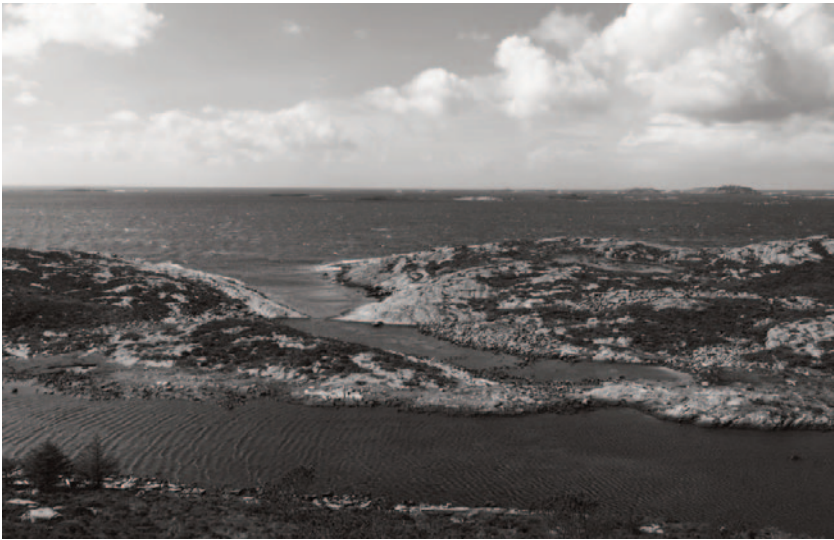
Figur 3. Avløypet på Seløyna i Øygarden. Her ser ein det karakteristiske eidet som mange av stadene har.

Atlaset viser i større målestokk kvart punkt i figur 2, altså kvar stad med eit namn som inneheld ordet avløype . Eg sende brev med aktuelle atlassider til historielag i områda der stadene ligg, med spørsmål om tolking og kartfesting. Eg sende brev til 29 ulike historielag og fekk 15 svar tilbake. Desse svara, i tillegg til informasjonen i namneinventaret og sjølve kartfestingane, har vore grunnlaget for analysen.