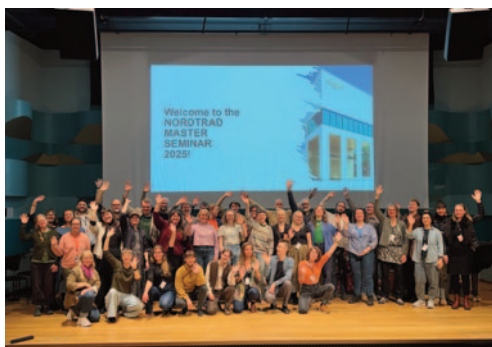
Nortrad masterseminar.