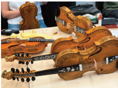
Instrumentverkstad. Til høgre: Magnus Nedregård.