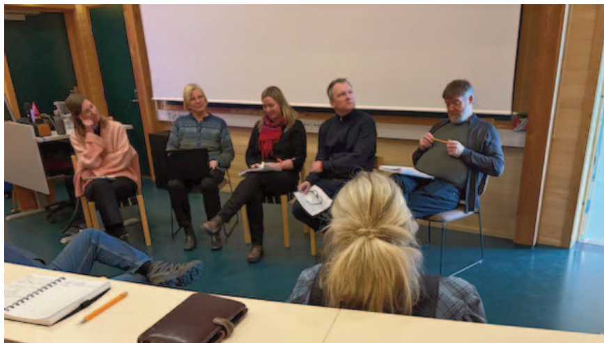
Fra UFFD Forumtreff.