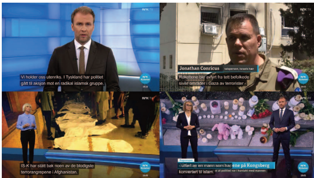
Illustrasjon 1: Konflikter og terror: Arrestasjoner i Tyskland 25. februar, 16:46 (øverst til venstre), Rakettangrep fra Gaza 11. mai, 01:47 (øverst til høyre), IS-Ks terrorangrep i Afghanistan 27. august, 06:56 (nederst til venstre) og Kongsbergdrapene 14. oktober, 01:15 (nederst til høyre).

får bred dekning. Hamas sine rakettangrep på Israel i mai dekkes i flere saker og Talibanens gjenerobring av Afghanistan, som kulminerer med erobringen av Kabul 15. august og den etterfølgende evakueringen, gis oppmerksomhet gjennom hele året. I et flertall av disse sakene inngår islam og muslimer.