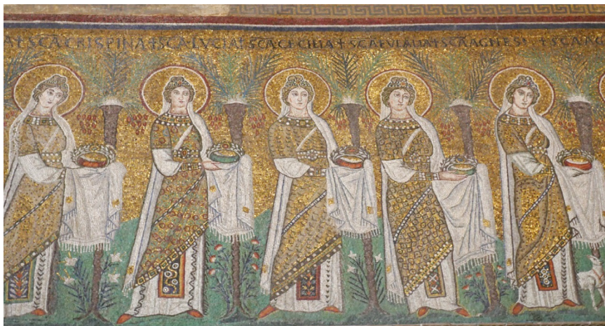
Fig. 1: Santa Lucia i prosesjon med andre jomfruhelgener, fra Sant'Apollinare Nuovo i Ravenna.

er øynene på et fat, okser og lyst hår. Legenda Aurea , middelalderens mest populære bok og kalender, forteller at 13. desember minner Lucias Dies natalis , den dagen hun dør fra det jordiske liv og fødes inn i himmelen. Grunnen til at Lucia fikk så sterkt fotfeste i Nord-Europa, har nok i stor grad med mørketiden å gjøre. 13. desember ble tradisjonelt regnet som dagen for solsnu, og det at navnet hennes kommer fra ordet lux , som betyr «lys», passet fint med overgangen til lysere tider. I motsetning til andre jomfruhelgener, som Cecilia (med minnedag 22. november) og Agnes (21. januar), ligger det allerede i Lucias navn et meningspotensiale som passer særlig godt i den skandinaviske konteksten, og som forsterkes av de hvite draktene, lysene og kronen til prosesjonsdeltakerne.