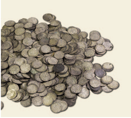
Figur 3. Brusselskatten. Engelsk sterlingmynt (pennies) og engelsk sterlingsølv utgjorde den viktigste handelsvalutaen i store deler av norsk middelalder, og det samme gjaldt stordelen av det nordlige Europa. Brusselskatten er det største funnet av middelalderske sølvmynter noensinne, både når det gjelder antall, vekt og verdi. Skatten, som ble funnet i sentrum av Brussel i 1908, inneholdt omtrent 150 000 sølvmynter av penny-type, dvs. med vekt på ca. 1,4 gram og sølvinnhold ca. 92,5 %. Myntene var fordelt på 83 500 engelske pennies og 70 000 lokale flamske pennies. De engelske var nesten i sin helhet av den såkalte Long Cross-typen, som ble introdusert under kong Henrik III i 1247.

til Egypt for å støtte Det femte korstoget hadde tømt pavekammeret for likvider og etterlatt betydelig gjeld. Den videre forsendelsen fra Paris til Roma skulle sannsynligvis utføres av ordensbrødrene. 26 At den norske avleveringen skjedde akkurat ved St. Victorklosteret, har sammenheng med at den norske kirken hadde nær relasjon til dette klosteret og dets klosterschule, som utdannet en rekke norske geistlige fra 1100-tallet og utover middelalderen. 27