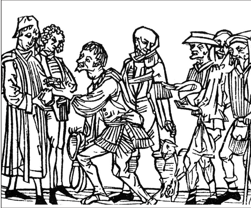
Figur 10. Kirkeskatt og ofringer. Efter Zamorensis 1479. Kilde: Märcher 2018: 319, fig. 5.42.

Men verken floriner og andre gullmynter eller de engelske sterlingene avspeiler faktiske betalinger fra folk i de norske bispedømmene, det gjelder nok snarere valuta-beløp fremkommet gjennom kollektorenes omregninger eller omvekslinger, ofte fo-