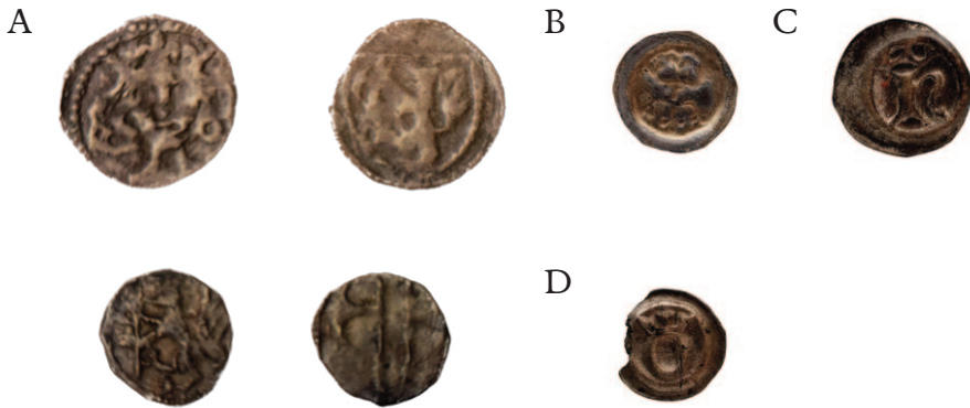
Figur 5. Norske mynter etter 1319. Bildet viser mynter som ble benyttet ved betaling av peterspenger i Norge etter 1319 og frem til sølvtørken stoppet innsamlingene på 1360-tallet: A. (1) Magnus Eriksson. Penning med kronet brystbilde en face / riksvåpen ca. 1320–1360 (Skaare II nr. 268) og (2) halvpenning med løve / økser (Skaare II nr. 271). B. Hulpenning (brakteat) med to fravendte kroner utgitt under Håkon VI Magnusson (1355–1380, Skaare II nr. 282). Hopperstad stavkirke. Tilsvarende mynter ble også utgitt i Sverige. C. Hulpenning (brakteat) med kronet monogram h preget under Håkon VI Magnusson (Skaare II nr. 275) Kinsarvik kirke. D. Hulpenning (brakteat) kronet monogram O preget under Olav IV (Skaare II nr. 277).

norsk myntunion. 47 Innsamlingsregnskapene viser hele veien at de pavelige kollektorer fulgte disse satsene.