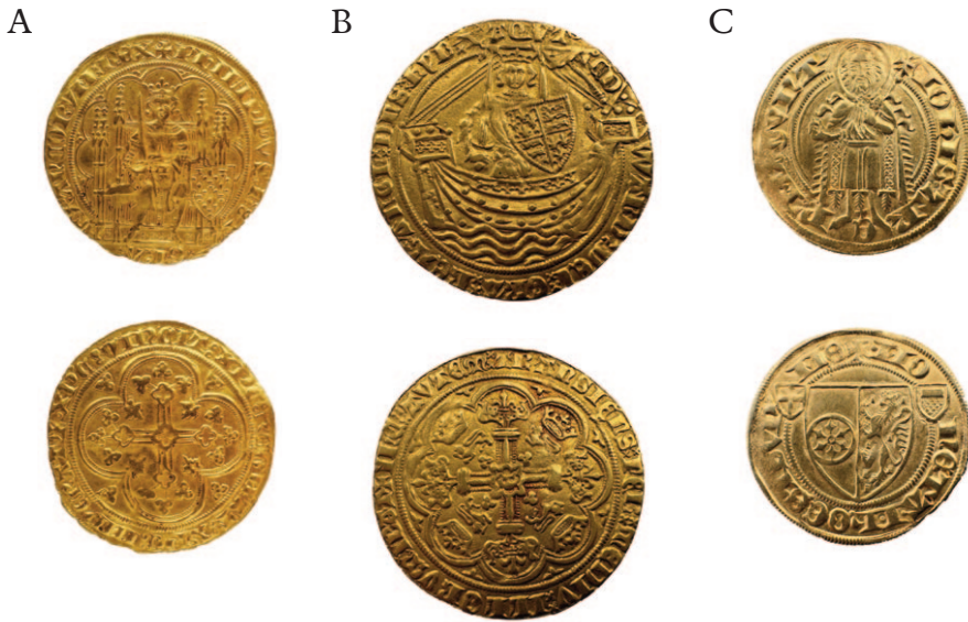
Figur 9. Gullmynter brukt ved overføringer av paveskatter på 1400-tallet. I tillegg til gullflorinen var det en mengde gullmynter som sirkulerte i den internasjonale handelen. Følgende er blant dem som nevnes ved overføringene av peterspenger fra Norge til Roma på 1400-tallet: A. Fransk écu fra Philip VI preget ca. 1337–1349. En av mange typer gullmynter fra denne monarken, og en av de gjeveste med nesten 4,5 gram gull. B. Engelsk nobel fra Edward III (1329–1377). Med 7,7 gram rent gull var den fremst blant alle europeiske mynter i middelalderen. C. Gylden (florin) fra Mainz i Tyskland, erkebiskop Johann II von Nassau (1414–1417). En av de mange «rhinskgylden» som sirkulerte i det nordlige Europa, og som gjennomgående hadde lavere kvalitet enn den originale florinen fra Firenze.

skattekommissær som besøkte Stavanger. De gjengitte beløpene – alle uttrykt i utenlandsk, hard valuta – var på ingen måte ubetydelige. 140 gylden (trolig av rhinlandsk type) fra Stavanger og nær hundre fra Hamar, mens det fra Oslo ble overlevert 40 engelske gullnobler i tillegg til drøyt 400 gylden og diverse utenlandske skillingsmynter, samt en post omtalt som «slitt mynt fra Oslo» (DN IV 870; jfr. Hellan 2012: 15). Gulldelen av disse beløpene utgjorde alene ca. 800 gylden som tilsvarte om lag 650 gullfloriner, som basert på vanlig vekslingskurs tilsvarte drøyt 100 pund sterling,