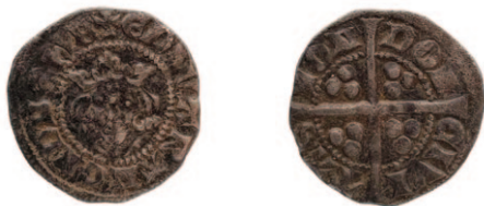
Figur 6. Engelsk sterling. England, Edward I–II, class 10cf4, preget London ca.1309. Engelske sterlinger (pennies) av Edward-typen ble fra 1279 produsert med nærmest uendret utseende og størrelse i mer enn hundre år under Edward I, Edward II og Edward III. Med en vekt på ca. 1,4 gram og sølvinnhold på hele 92,5 % var sterlingene så verdifulle at de sjelden var aktuelle når folk i Norge betalte peterspenger. Derimot var de høyaktuelle når de pavelige kollektorene skulle veksle norsk mynt i hard valuta før skattemidlene ble sendt ut av landet.

Hvordan man snur og vender på skattetallene fra Norge, vil det selvsagt ikke rokke ved at disse bidragene var små sammenlignet med det paven hentet inn fra større og rikere land. Vi har sett at det årlige peterspengebidraget fra England utgjorde et fast beløp i størrelsesorden 200 pund sterling. Basert på den normale vekslingskursen de anvendte i Avignon (1 florin = 40 sterlinger eller 1 pund sterling = 6