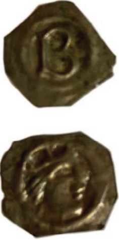
Figur 2. Norske brakteater fra tidlig 1200-tall. Under første del av 1200-tallet ble det preget et stort antall brakteater på åttekantete blanketter, med vekt ned til ca. 0,10 gram og sølvinnhold på omkring 25 %. Brakteatene var forsynt med ulike bokstaver, kongeportretter, fabeldyr og kors. Her vises: A. Bokstavbrakteat med B, som ofte tolkes som myntstedssignatur for Bergen (Skaare II nr. 168). B. Brakteat med kronet kongeportrett (Skaare II nr. 177). Brakteater som dette kan ha inngått blant de peterspengene som var innsamlet i Norge og senere ble vekslet om i edelmetaller og utenlandsk valuta og til slutt avlevert ved St. Victor-klosteret i Paris i 1221. Men de kan også være preget senere i Håkon Håkonssons tid.

Historikeren Odd Arne Johnsen var overbevist om at påbudet i 1206 og betalingen i 1221 må ha stått i direkte sammenheng med kirkestriden i årene 1190-1202, og at den norske peterspengeordningen hadde stoppet opp under kong Sverres tid. Sverre sto i et konfliktforhold til paven og ble lyst i bann gjentatte ganger. Det hjalp neppe på forholdet at Sverre, for å sikre sin posisjon blant bøndene, støttet deres motstand mot nye økonomiske krav fra kirken, blant annet i form av tiende og peterspenger (Johnsen 1955: 191; Moseng et al. 2007: 125–133, særlig 130). Kildene er imidlertid begrensede, og gjør det vanskelig å anslå hvor mange år med peterspenger oppgjøret i 1221 gjaldt. En sammenligning med innbetalingen som ble foretatt nøyaktig hundre år senere, i 1321 (se nedenfor), tilsier at det må ha dreid seg om minst fem år, trolig mer.