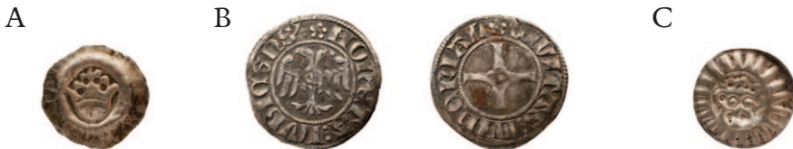
Figur 8. Noen mynter brukt i Norge på 1400-tallet. Det ble ikke preget mynter i Norge i hundreårsperioden fra 1380-tallet til 1480-tallet. Her er et lite utvalg av utenlandske mynter som var i sirkulasjon: A. Hulpenning utmyntet under Erik av Pommern (1396–1439) i Lund, den gang Danmark (Galster 1972: 48, nr. 5). Borgund stavkirke. B. Witten fra Lübeck med tohodet ørn og kors, produsert fra 1365 som de første nordtyske mynter av sterlingkvalitet. Jesse 302. C. Oksehodebrakteat fra Mecklenburg (Oertzen). Hopperstad stavkirke. Det var trolig mynter som de to minste (A og C) som ble brukt ved betaling av peterspenger.

De tre første kildene består av kvitteringer som ble utstedt av omreisende skattekollektorer som mottok peterspenger fra Stavanger bispedømme . Kvitteringene er datert henholdsvis 1413, 1417 og 1421, og i alle tilfeller ble pengene overlevert i Bergen (RN IX 869, 1251 og X 178; Skaare 1981: 136–146). Kvitteringene fordeler seg på tre fireårsintervaller for innbetaling. Ved samtlige anledninger ble skattebeløpet oppgitt i utenlandsk, hard valuta, særlig engelsk: gullnobler og sølvmynt målt i engelske pund. Men det skinner samtidig gjennom at dette var noe annet enn den «blandede mynt» som faktisk var innsamlet i stiftet, der det særlig ble nevnt tysk mynt (witten). Dessuten ble det allerede i 1413-kvitteringen vist til at det var mottatt «kongens mynt som nå er gjengs i disse egner». Trolig gjaldt dette kronebrakteater som ble slått i Danmark 1405-1420 under kong Erik av Pommern (Hellan 2012: 14–15).