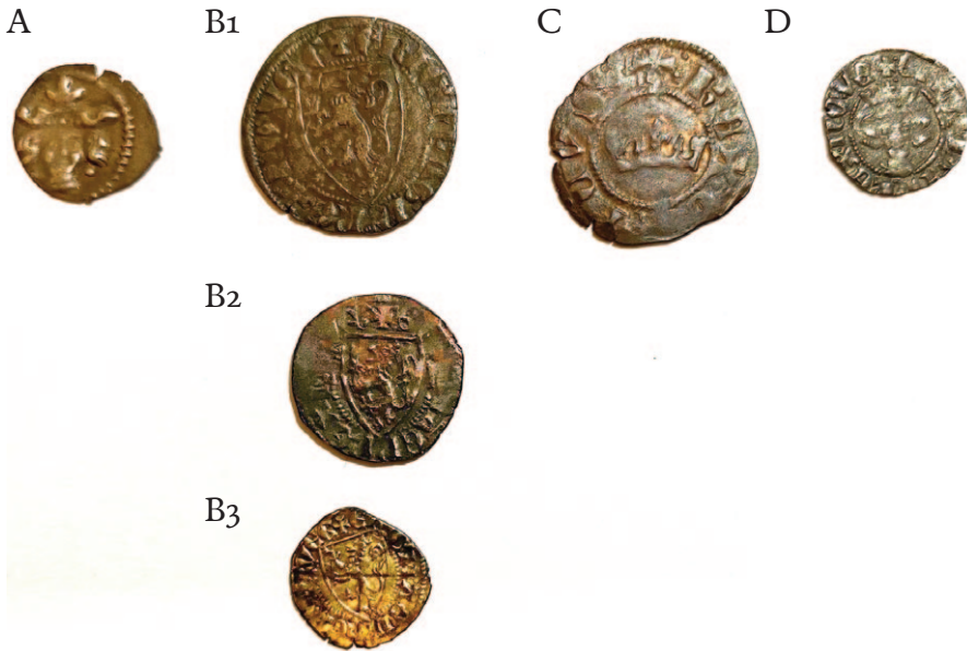
Figur 4. Norske mynter fra 1270-, 1280- og 1290-tallet. Under kong Eirik Magnusson (1280–1299) ble det utgitt solide, tosidige mynter i tre valører: penninger, samt halv- og kvartpenninger. De ble preget i Bergen og Tønsberg, mens kongens bror Håkon utga mynter med samme standarder i Oslo. Her vises mynttyper som ble benyttet av folk da peterspenger ble samlet inn i Bergen bispedømme årene 1294–1300: A. Brakteat som skrev seg tilbake til Magnus Lagabøtes tid ( subtilis monetae ), ca. 1263–1275 (Skaare II nr. 264), Borgund stavkirke. B. (1) Penning av riksvåpentype ( grossi erici ), ca. 1285–1290 (Skaare II nr. 234), UMKs hovedsamling. (2) Halvpenning av riksvåpentype, ca. 1285–1290 (Skaare II nr. 235), Lom stavkirke. (3) Kvartpenning av riksvåpentype, ca. 1285–1290 (Skaare II nr. 236), Lom stavkirke. C. Penning av svartkronetype ( nigri coronati ), ca. 1290–1295 (Skaare II nr. 237), Borgund stavkirke. D. Penning av hvitrosetype ( albi rosati ), ca. 1295–1299 (Skaare II nr. 239), Lom stavkirke. Regnskapet fra Bergen bispedømme viser at folk gjennomgående valgte å benytte seg av de dårligste myntene som var i omloop, dvs. halv- og kvartpenningene samt svartkronene (type B2, B3 og C) som alle hadde sølvgehalt på under 10 %. Men regnskapene sier ikke noe direkte om hvor mange slike mynter som ble avkrevd den enkelte skattepliktige.