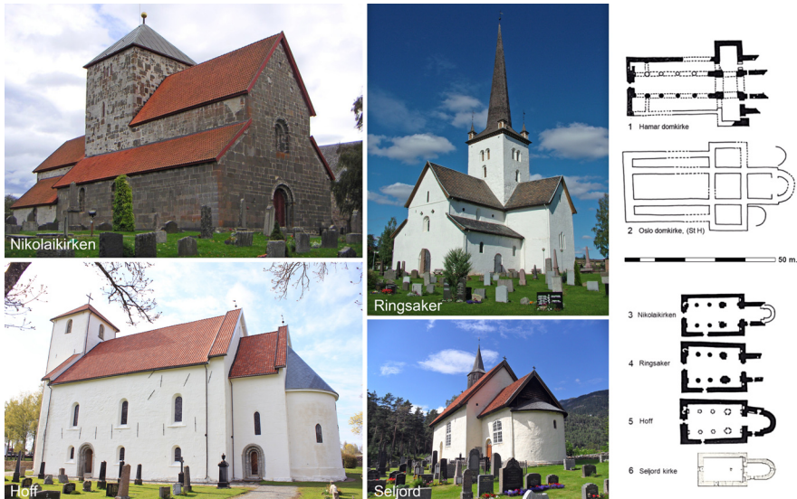
Figur 3. Noen av de antatte tredingskirkene i Hamar bispedømme står seg ut bygningsmessig. Her basilikakirkene St Nikolai på Gran og Ringsaker, og dessuten Hoff på Toten, nå med hevede tak over sideskipene. Seljord er en av få steinkirker i øvre Telemark. Byggearbeidene for de fleste større steinkirker i Eidsivatingslagen ble påbegynt i første halvdel av 1100-tallet, altså før Hamar bispedømme var opprettet.