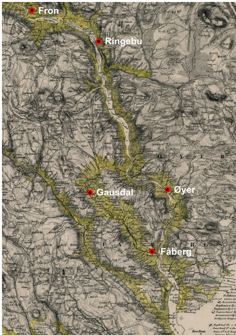
Figur 8. Biskopene visiterte i middelalder og senere nordre del av Hamar bispedømme om vinteren, vanligvis i januar og februar. Ferden gikk på slede over frose vann og på vintervei. Ifølge kristenretten hadde biskopen rett til underhold og fire overnattinger og før til seks hester. Figuren viser visitaskirker i søndre Gudbrandsdalen. Utsnitt av kart 1880 Kart over Kristians Amt. CC BY-NC.

Ti av 13 kirker i Hamar bispedømme med kjent visitas i perioden 1333 til 1470 hadde status som hovedkirke i 1570-årene. De tre uten var Lunner, Jevnaker og Gransherad, og dessuten «Vestfjorden» i Tinn prestegjeld (Mæl eller Dal kirke). Majoriteten av visitaskirker i middelalderen var dermed hovedkirker i 1570.