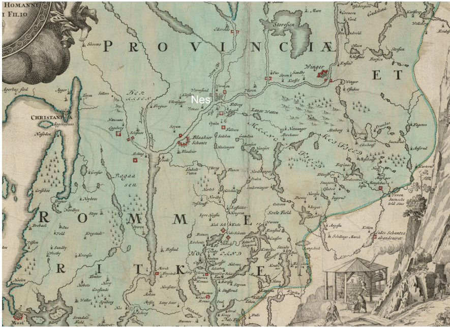
Figur 4. Romerike lå i Eidsivatingslagen, men under Oslo bispedømme. Erkedegnen ved Oslo domkapitet hadde patronatsrett til Nes kirke og var også prost over Romerike og Solør. Vikaren på Nes synes å ha hatt delegert prostemyndighet. Utsnitt av kart over Akershus amt 1729. Kobberstikk oppmålt av Iohannis Baptistæ Homann. CC BY-NC.

forvente at tredingsbenevnelsen festet seg som begrep for prestegjeld, noe som ikke er tilfellet. Noe liknende skjedde i alle fall med fjerdinger som det mange steder var flere av enn fire (Indrebø 1935; Ødegaard 2015).