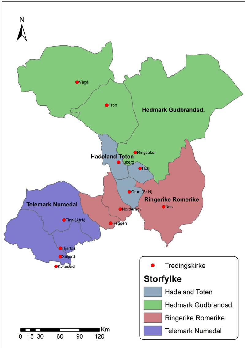
Figur 6. Forslag til storfylker, tredinger og tredingskirker i Eidsivatingslagen før ca. 1150. Kviteseid lå trolig i Borgartingslagen. Kart ved Frode Iversen, CC BY-NC.