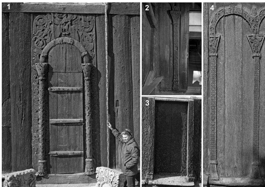
Figur 7. Middelaldersk treskurd Vågå kirke, ca. 1100–1150. Skipet har portal både i sør (1) og nord (3). Motivet nedsenkede stjerner (4) kom til Norge fra Normandie via England. (1) Kunsthistoriker Erla K. B. Hohler ved sørportalen som har symmetrisk motstilte bevingede drager i toppen, med hodene slynget rundt portalbuen, og en løve mellom. Slike stiltrekk finnes også ved den eldste domkirken i Trondheim. (2) Nordportalen er måleriktig med 1, men har blitt avkuttet i toppen i nyere tid. (2) Amnen eldre treskurd finnes også i kirken.