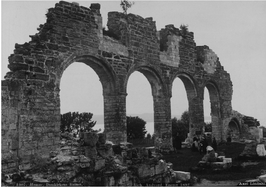
Figur 2: Hamar domkirke - ecclesia majoris . Bispetet ble herjet og ødelagt av svenske soldater i 1567. Det var altere ved flere av søylene. Kirken hadde basilikaform og de tre «nødmurte» vinduene øverst på bildet slapp opprinnelig inn lys fra oven i midtskipet. Her et fornemt uidentifisert utenlandsk besøk ved ruinen i 1892. Bilde er tatt mot sørvest med Helgøya i bakgrunnen.

og proster og andre kirkelige formenn», og dessuten hovedprester. Det fremgår at hovedkirkene hadde « mikla sokn ok víða », altså vide «storsogn» (NgL III: 242–243). I en bestemmelse fra et provinsialkonsil i Oslo i 1306 ser betegnelsen majores ut til å omfatte både fylkeskirker og domkirker: ... majori ecclesia cuiuslibet civitatis, nec non in aliis matricibus ecclesiis (... den største kirke i hver by og også i de andre moderkirkene). 3 Domkirker og fylkeskirker var derfor ecclesia majores (fig. 2).