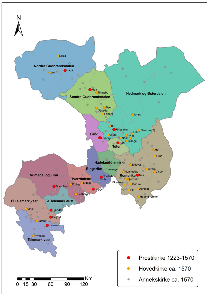
Figur 5. Kirker og prostiinnndeling i Hamar bispedømme og på Romerike i senmiddelalder. Kirkene er kartert etter Oslo og Hamar bispedømes jordebok 1574–1577. Kart ved Frode Iversen, CC BY-NC.