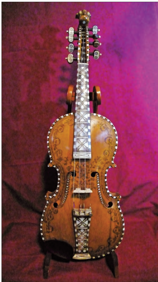
Hardingele laga av Aasmund Sandland, 1915. Rosa i ein variant av Helland-stilen. I forfattarens eige.