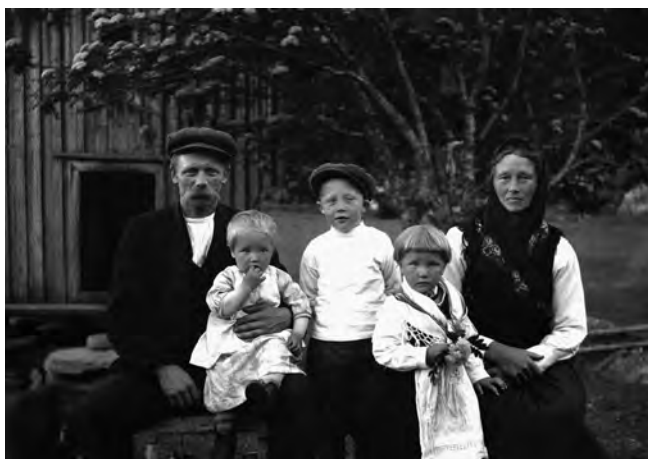
«Vestgaard Folki, Seljord. Familie- portrett, Vestgarden, Trollebotn 1915»

Dokumentasjonsarbeidet blir fra 1880- og -90-årene preget av bruk av fotografi som dokumentasjonsmetode, også andre steder i Europa. «Etter innføringa av tørplatteteknikken i 1880-åra blei fotografiet tatt aktivt i bruk til mange andre former for registrering. Statlege og kommunale instansar brukte fotografi til å dokumentere moderniseringa og urbaniseringa av det norske samfunnet», skriver Peter Larsen og Sigrud Lien (Larsen, Lien 2007: s. 163).