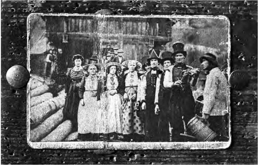
Avfotografering av bondebryllup fra Lårdal, 1872.

Fotografiet er interessant av ulike årsaker. For det første er det en avfotografering fra 1917, av et eldre fotografi. Man ser tydelig stiften som holder fotografiet fast på veggen og alle de gamle stifteshull som omkranser det. Vest-Telemark Blad skrev om hendelsen 14. april 1984, og intervjuer Aslak Djuve. Fotografiet Vest-Telemark Blad publiserte, er nesten identisk med avfotograferingen som Rikard Berge tok. «Under bilete er det skrive med blyant: Fotografert på Aakeren i Lårdal 1872 når bruri vert skauta umatt andre brudlaupsdag» (Vest-Telemark Blad 1984). Selv om det dreier seg om to ulike fotografier, er det ikke tvil om at de to bildene er tatt fortløpende ved samme anledning og av samme fotograf, Berdal i 1872. På bildet avisen publiserte i 1984, ser man skjenkemesteren til venstre i bildet. På avfotograferingen i Berges fotosamling befinner samme person seg i høyre side av fotografiet. De øvrige portretterte har også noe ulik oppstilling, men utover dette er fotografiene svært like. Spellemannen som er fotografert, er trolig Tarjei Tvigva. «Tvigva var truleg den mest aktive spellemannen i Lårdal på den tid, og ein